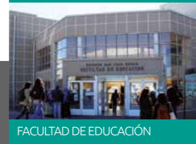
FACULTAD DE EDUCACIÓN

CAMPUS SAN ANDRÉS ALONSO DE RIBERA 2850 CONCEPCIÓN TEL (56) 41 234 5000 FAX (56) 41 234 5001 ucsc@ucsc.cl