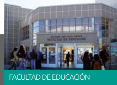
FACULTAD DE EDUCACIÓN

Universidad Católica de la Santísima Concepción