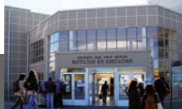
FACULTAD DE EDUCACIÓN

CAMPUS SAN ANDRÉS ALONSO DE RIBERA 2850 CONCEPCIÓN TEL (56) 41 234 5000 FAX (56) 41 234 5001 ucsc@ucsc.cl