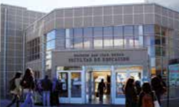
FACULTAD DE EDUCACIÓN

CAMPUS SAN ANDRÉS ALONSO DE RIBERA 2850 CONCEPCIÓN TEL (56) 41 234 5000 FAX (56) 41 234 5001 ucsc@ucsc.cl